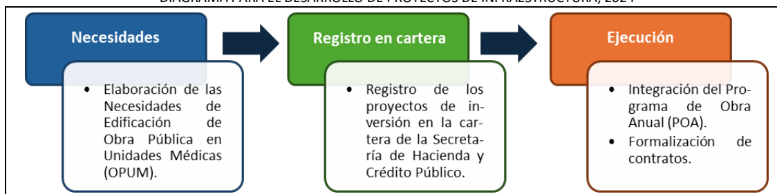
DIAGRAMA PARA EL DESARROLLO DE PROYECTOS DE INFRAESTRUCTURA, 2024