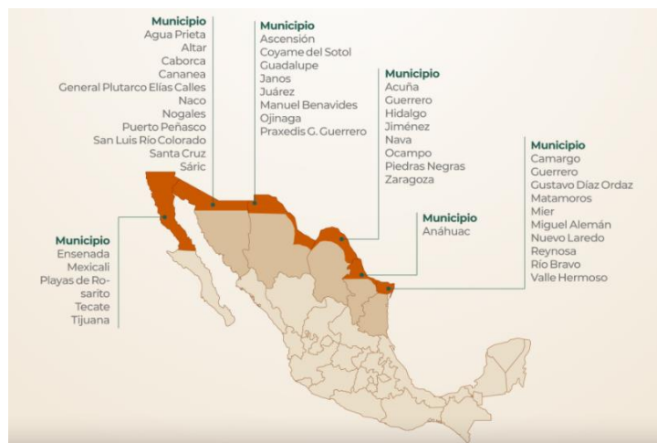
MUNICIPIOS BENEFICIADOS CON EL PROGRAMA “PZLFN”