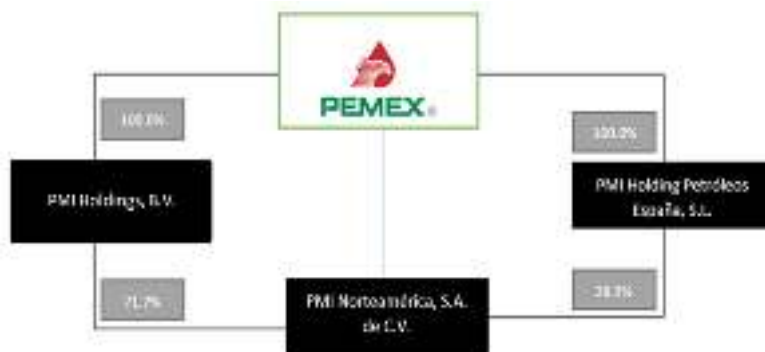
PARTICIPACIÓN ACCIONARIA DE PETRÓLEOS MEXICANOS EN PMI NORTEAMÉRICA, S.A. DE C.V.