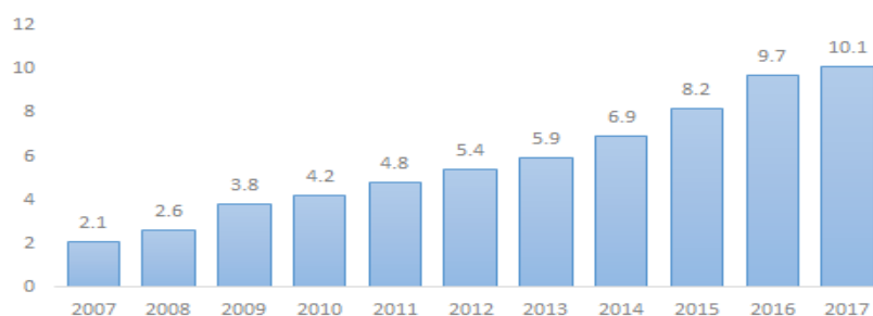
SALDOS DE LA DEUDA DEL GOBIERNO FEDERAL, DE 2007 A 2017 (Billones de pesos)